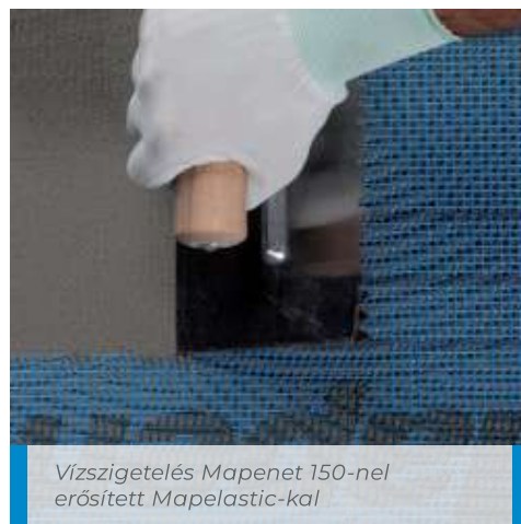
Vízszigetelés Mapenet 150-nel erősített Mapelastic-kal