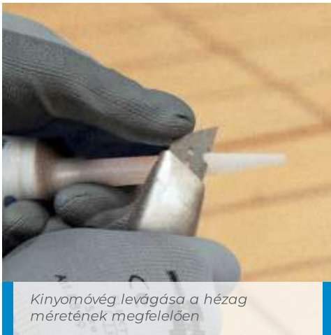
Kinyomóvég levágása a hézag méretének megfelelően