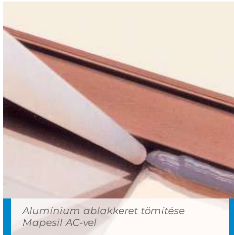
Alumínium ablakkeret tömítése Mapesil AC-vel