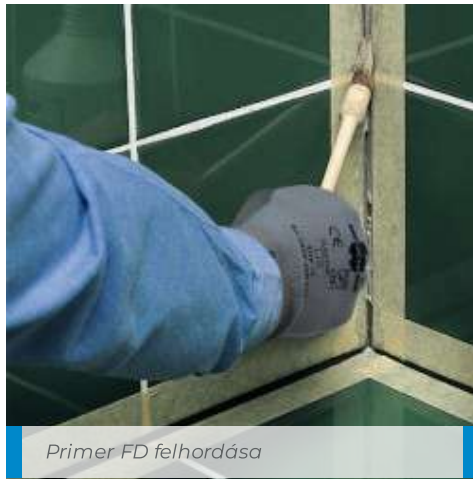
Primer FD felhordása