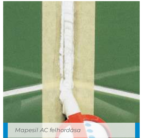
Mapesil AC felhordása