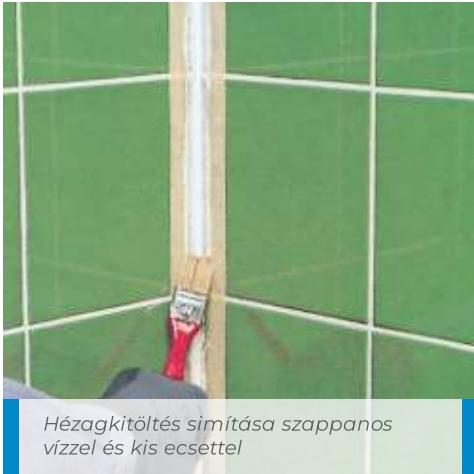
Hézagkitöltés simítása szappanos vízzel és kis ecsettel