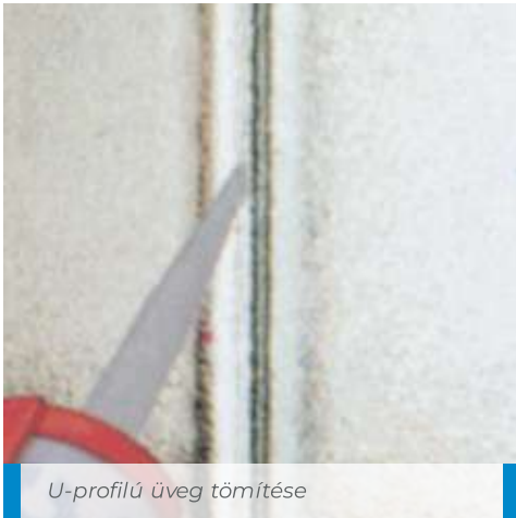
U-profilú üveg tömítése