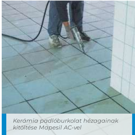
Kerámia padlóburkolat hézagainak kitöltése Mapesil AC-vel