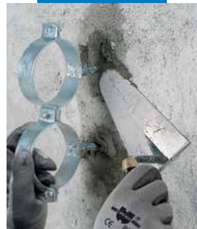
Csőkonzol rögzítése Lampocem-mel