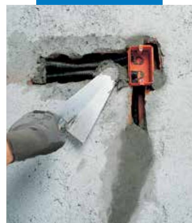
Elektromos csővezés és dobozok rögzítése Lampocem-mel