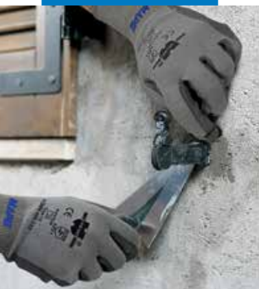
Ablak horgonycsavarjának rögzítése Lampocem-mel