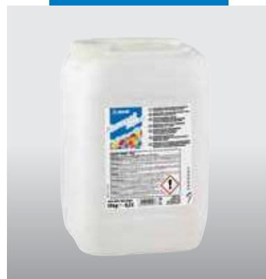
A Keranet folyadék kannában és palackban is kapható

A termékre vonatkozó referenciák kérésre rendelkezésre állnak, illetve a www.mapei.hu weboldalon hozzáférhetők.