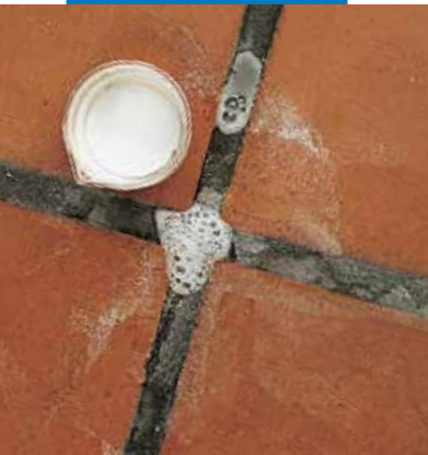
Só kivirágás tisztítása