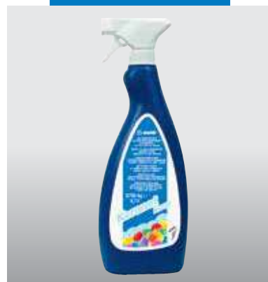
A Keranet Easy 0,75 literes szórófejes palackban kapható