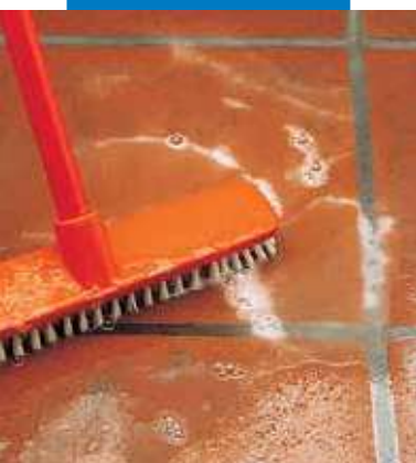
Folyékony Keranet tisztítása tisztítókefével