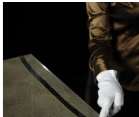
Hagyományos cementkötésű termékkel