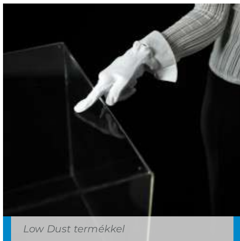
Low Dust termékkel