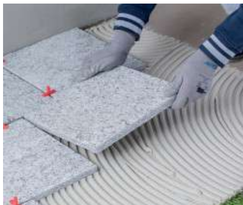
Természetes kövek ragasztása kültéren

A hő- vagy hangszigetelő táblák pontszerű Keraflex Maxi S1 -gyel felragasztásához használjon vakolókanalat vagy simítót, melynek fajtáját és méretét a felület egyenletessége és a tábla súlya határozza meg.