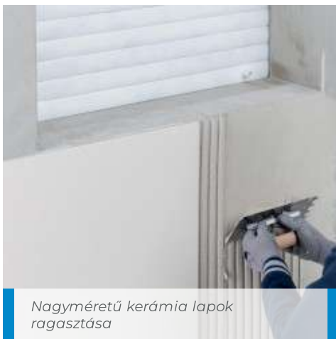
Nagyméretű kerámia lapok ragasztása