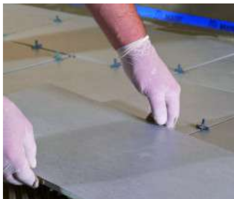
Porcelán lapok fektetése Keraflex Extra S1-gyel