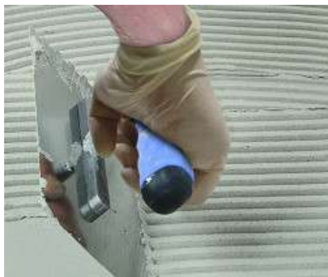
Keraflex Extra S1 felhordása fogazott simítóval

A falakon a hézagokat 4-8 óra eltelte után ki lehet fugázni, a padlón lévő hézagok 24 óra után fugázhatók. Használja a MAPEI széles színválasztékában elérhető cementkötésű vagy epoxi fugázóanyagait. A tágulási hézagokat a MAPEI speciális rugalmas hézagkitöltő anyagaival tömítse.